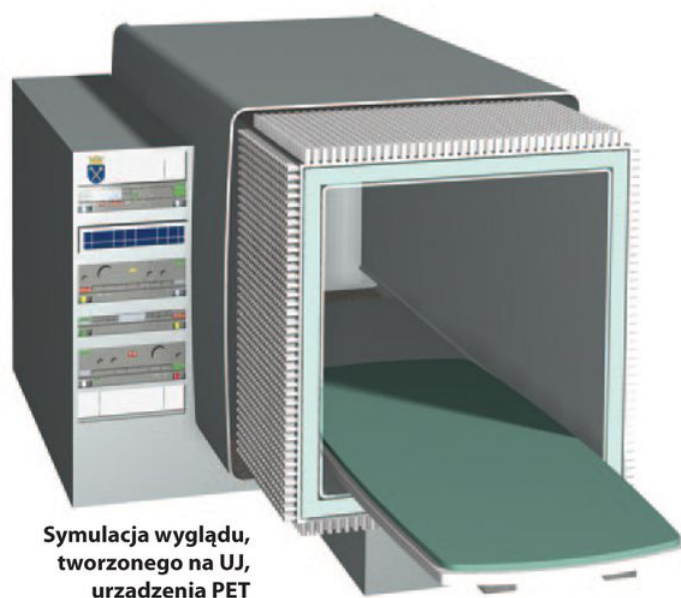
Symulacja wyglądu, tworzonego na UJ, urządzenia PET