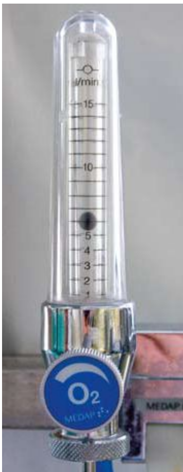
Ryc. 1. Przeływomierz do tlenoterapii - przepływ tlenu ustawiono na 6 l/min

5. Urządzenia do nawilżania i ogrzewania gazów oddechowych – są korzystne przy oddychaniu (zwłaszcza długotrwałym) przez maskę mieszaniną o dużym stężeniu tlenu, natomiast niepotrzebne przy tlenoterapii przez cewnik donosowy. Najwydajniejsze są aktywne układy nawilżania. Brak należytej higieny podczas nawilżania bywa przyczyną zakażeń układu oddechowego. Nie należy stosować urządzeń, w których tlen jest nawilżany poprzez przejście przez warstwę płynu z kaniuli umieszczonej na dnie zbiornika z cieczą, ponieważ nie ma dowodów na korzyści z takiego postępowania, a jednocześnie zwiększone jest ryzyko zakażenia.