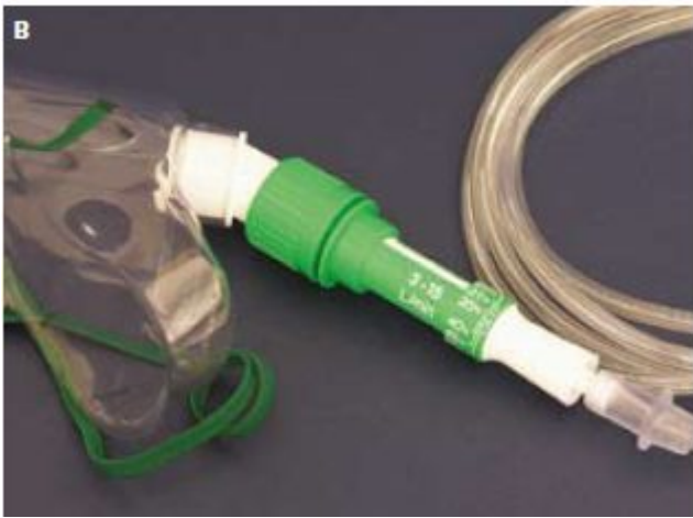
Ryc. 4. Maska z zastawką Venturiego - wymienną (A) i regulowaną (B)