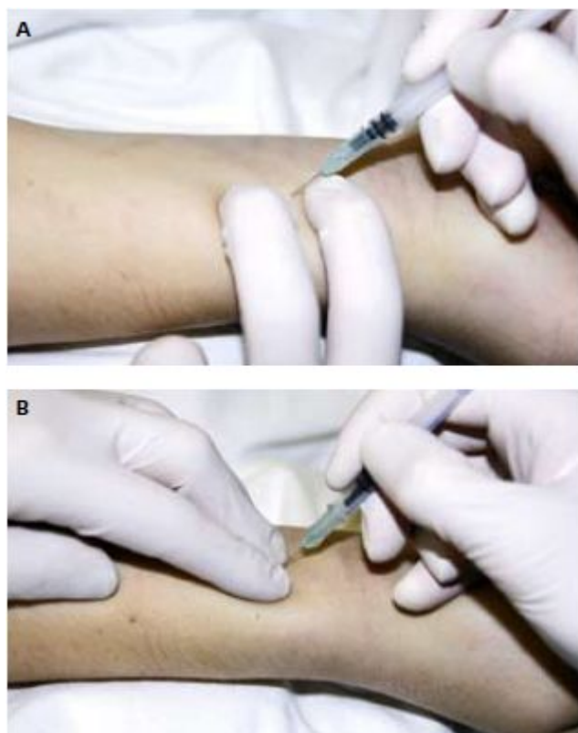
Ryc. 7. Nakłucie tętnicy promieniowej do badania gazometrycznego

5) oznaczenie należy wykonać w ciągu 15 min; jeśli to niemożliwe - krew można przechować \leq 1 h w lodówce w temperaturze \sim 4^\circ\text{C} i transportować w naczyniu z lodem.