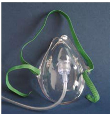
Ryc. 3. Maska prosta (zwykła)