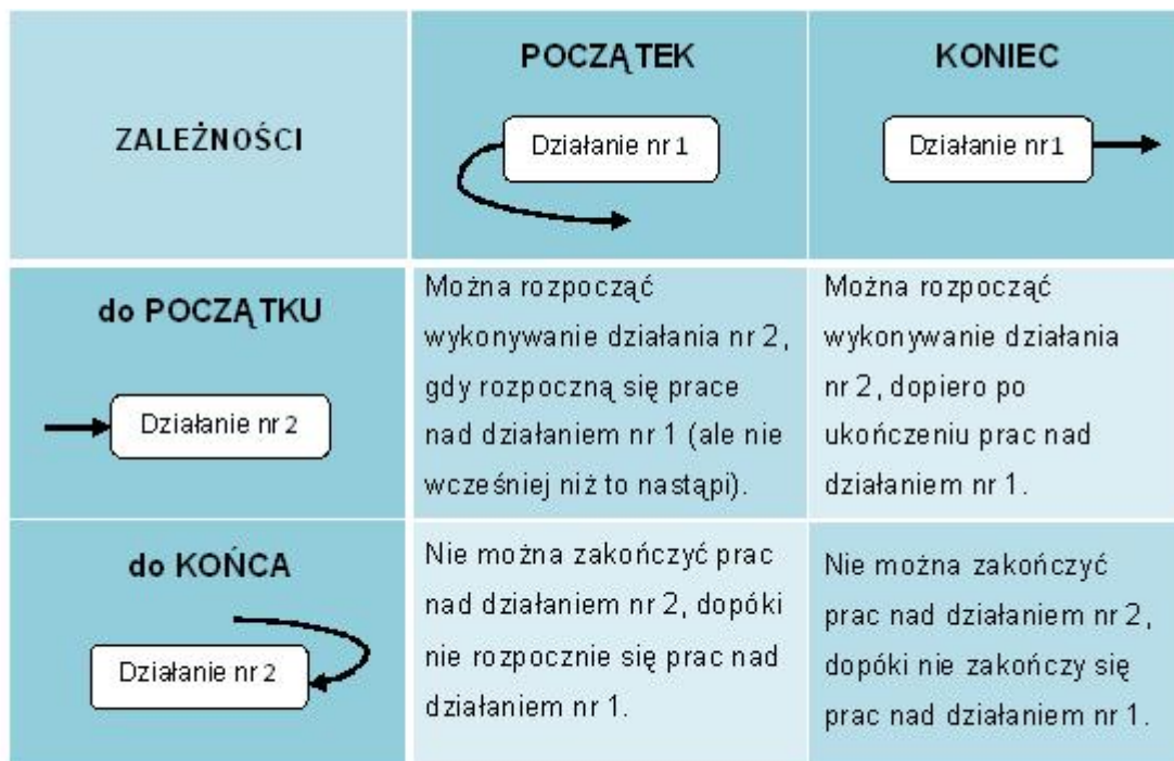
Tab. 1. Zależności pomiędzy działaniami nr 1 i nr 2 [1], [3].

Przedstawione powyżej zależności, mają swoje źródło w postaci ograniczeń łączących te działania. Wysocki R. K. wskazuje cztery główne grupy ograniczeń: techniczne, związane z zarządzaniem, międzyprojektowe oraz czasowe [1].