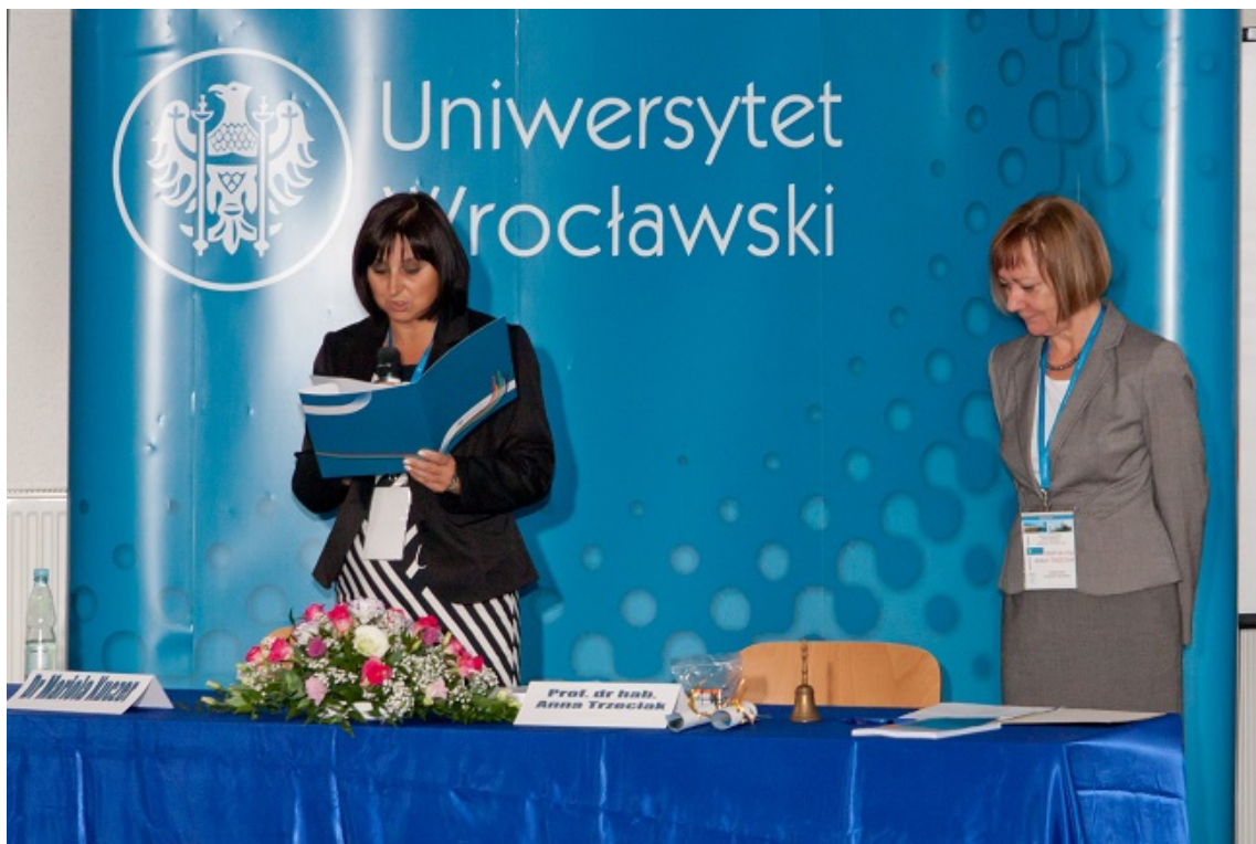
Otwarcie III OFMCh