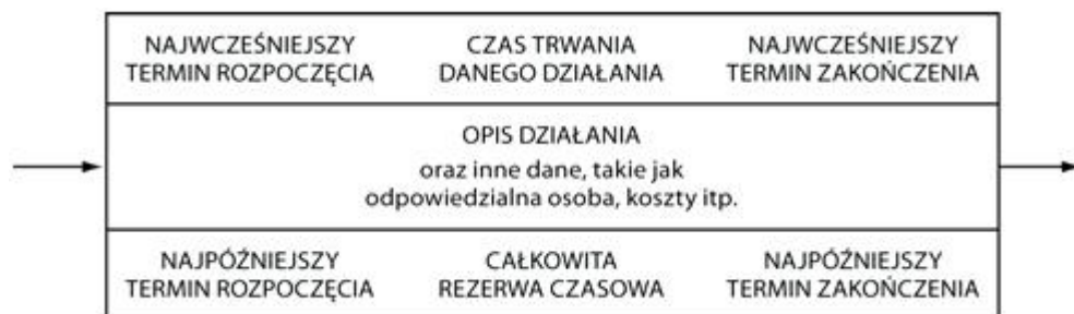
Ryc.2. Węzeł PERT [2].

Standardowo wykorzystywaną techniką weryfikacji i oceny projektów jest metoda PERT (ang. programme review and evaluation technique). Bazuje ona na uprzednio wykonanym diagramie logicznym, jednakże wymaga uzupełnienia działań (zwizualizowanych jako prostokąty) o dodatkowe informacje. W narożnikach prostokątów (zwyczajowo nazywanych węzłami) umieszcza się następujące dane: najwcześniejszy termin rozpoczęcia, najwcześniejszy termin zakończenia, najpóźniejszy termin rozpoczęcia oraz najpóźniejszy termin zakończenia danego działania podawane w jednakowych jednostkach (Ryc.2.).