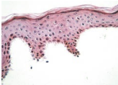
Fig. 1. Complete separation of human epidermis from dermis subsequent to incubation with dispase (haematoxylin-eosin, \times 400 ). Zdjęcie: Kompletny podział ludzkiego naskórka od skóry właściwej po inkubacji z dispazą (naturalna proteaza), http://www.medicaljournals.se/acta/content/?doi=10.2340/00015555-0019&html=1

Jako materiał do badań wykorzystano keratynocyty ludzkiej skóry, odpowiednio przygotowane. Komórki pobrano ze skóry pacjentów z otyłością poddanych wcześniej abdominoplastyce (plastyka brzucha). Komórki przygotowuje się przez odpowiednią preparatykę, na końcu próbki poddaje się wirowaniu w 4°C przez 5 minut, a żywotność keratynocytów mierzy się testem z błękitem trypanu [6].