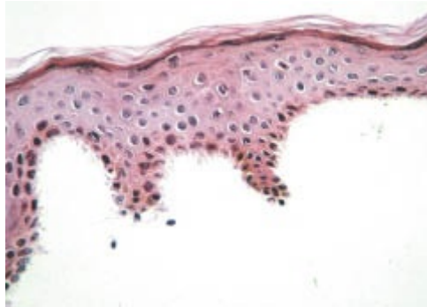
Fig. 1. Complete separation of human epidermis from dermis subsequent to incubation with dispase (haematoxylin-eosin, \times 400 ). Zdjęcie: Kompletny podział ludzkiego naskórka od skóry właściwej po inkubacji z dispazą (naturalna proteaza), http://www.medicaljournals.se/acta/content/?doi=10.2340/00015555-0019&html=1

Jako materiał do badań wykorzystano keratynocyty ludzkiej skóry, odpowiednio przygotowane. Komórki pobrano ze skóry pacjentów z otyłością poddanych wcześniej abdominoplastyce (plastyka brzucha). Komórki przygotowuje się przez odpowiednią preparatykę, na końcu próbki poddaje się wirowaniu w 4°C przez 5 minut, a żywotność keratynocytów mierzy się testem z błękitem trypanu [6].