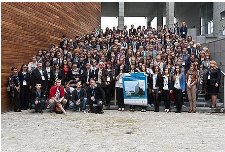
Grupa III OFMCh

Dziękujemy również wszystkim patronom medialnym: Centrum Edukacji i Rozwoju EFEKTY - portale: edukacja.net i uczelnie.net, czasopismu „Laboratorium - Przegląd Ogólnopolski”, miesięcznikowi "Chemik" oraz portalowi LABORATORIA.NET za wsparcie medialne.