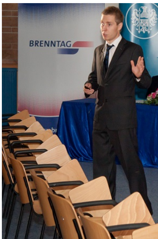
Zwycięzca konkursu na najlepszy komunikat ustny